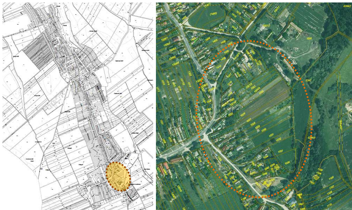
A terület helyszínrajzi adottságait és a kialakult állapotokat ismertető alaptérkép és légifelvétel.

A tervezési terület Szákszend Szák településrészén, a belterület délkeleti részén található.