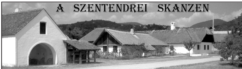
A SZENTENDREI SKANZEN

Mai számunkban egyszerre látogatjuk meg Magyarország tájegységeinek nagy részét, Szentendre határában. A várost átszelő úton táblák jelzik az ide vezető utat, elsősorban autóval érdemes idejönni (a parkolási lehetőség szinte korlátlan), vagy a hév állomástól autóbusszal. Gyalog elég messze van.