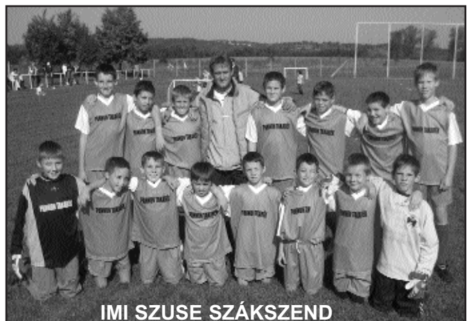
IMI SZUSE SZÁKSZEND

ci, csak egy kicsit más, mint az iskolában és edzésen művelt teremfoci. A szabályok hasonlóak, de más labdával, 4+1-es csapatokkal és apróbb szabályi eltérésekkel játsszák. A résztvevő hét csapatból a két nap eredményei alapján az IMI Szuse szákszendi gyermekei a 4. helyen zárták a