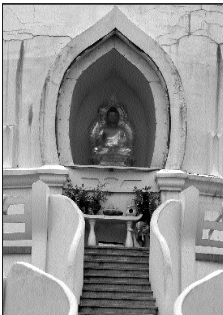
Buddha szobra a sztupa központjában

gű szentélye. A vallás szabályai szerint készült sztupa építése során növényi magvakat, vallási dokumentumokat, tibeti könyveket helyeztek az építmény betonjába. 1992. szeptember 28-án helyezték el a sztupa kupolája fölött kialakított üregben a vallásalapító Buddha földi maradványának néhány darabját: díszes tartóban lévő apró csontszilánkokat. A csontokat Tibet kínai megszállása idején a dalai láma tanítómestere menekítette Indiába. Az ereklye elhelyezésével vált a szántói sztupa szent zarándokhelyé. Európában ma csupán ez tartalmaz eredeti Buddha-ereklyét. (Európa több sztupájában Buddha tanítványainak földi maradványait őrzik ereklyeként). A sztupa Buddha szellemét, ugyanakkor bölcsességét, minden élőlényhez fűződő együttérzését és szeretetét is jelképezi. A béke, a boldogság és a megvilágosodás jelképe. A központi helyen látható Buddha-szobor Dél-Koreából származik. A sztupa zárt épület, bemenni nem lehet, a vallást a völgyben épült kolostorház imatermében gyakorolják.