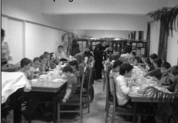
Záróünnepség a faluházban