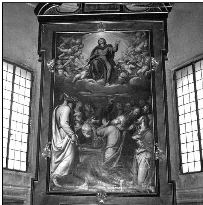
(Mária mennybevétele, Maria della Passione, Milánó)

A moldvai magyarok e napon mindenféle virágokat, gyógynövényeket szenteltettek, hogy majd ezzel füstöljék a betegeket, mennydörgésnél is ezt égették.